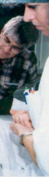
M. DECKER / GEMA OPTIKER

Die Zahl der dort eingehenden Erkundigungen über Verschönerungsmethoden