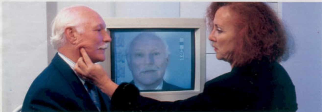
Face-Lift-Patient bei Computersimulation: „Obsession des Schön- und Jungseinmüssens“

Hinter geheimnisvollen Abkürzungen wie SMAS, SACS, SMILE oder FAME und