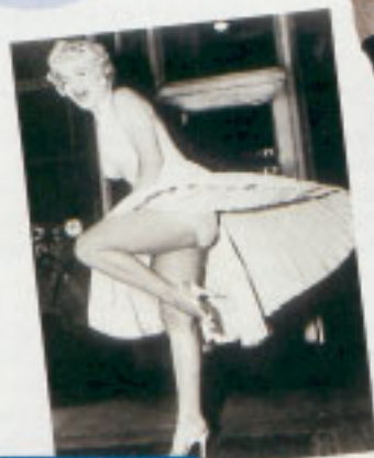
MARILYN MONROE 56 / 91,5 = 0,61