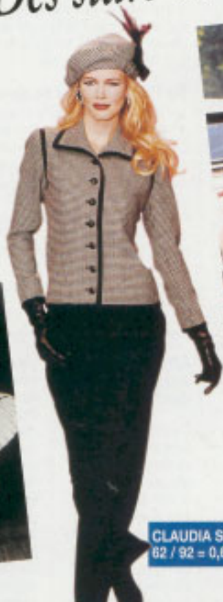
CLAUDIA SCHIFFER 62 / 92 = 0,67