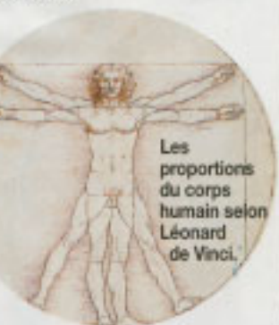
Les proportions du corps humain selon Léonard de Vinci.

La beauté varie mais son essence reste la même