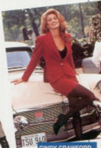
CINDY CRAWFORD 58 / 84 = 0,69