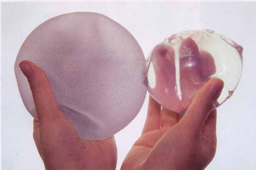
Silikon-Implantate: Eigens gezüchtetes biologisches Gewebe wird den Kunststoff ersetzen.

stellt. «Grosse Brüste wurden in Brasilien als primitiv betrachtet», sagt Kulturhistoriker Gilman. «Sie galten als Merkmal der schwarzen Unterschicht.» Bisher liessen sich deshalb die Frauen der weissen brasilianischen Mittelschicht ihren Busen verkleinern.