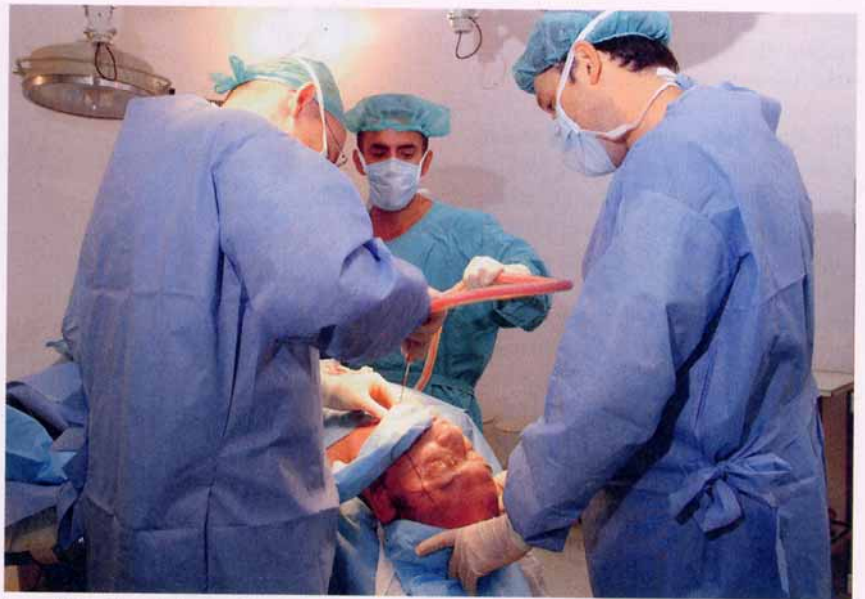
Augenlidstraffung bei einem Mann: An Beliebtheit das Fettabsaugen überholt.

Auch in der Schweiz hat die Augenlidstraffung das Fettabsaugen an Beliebtheit überholt. Die Operation kennzeichnet eine kurze so genannte social downtime von sieben bis zehn Tagen. Damit bezeichnen Ärzte die Zeit, die verstreichen muss, bis