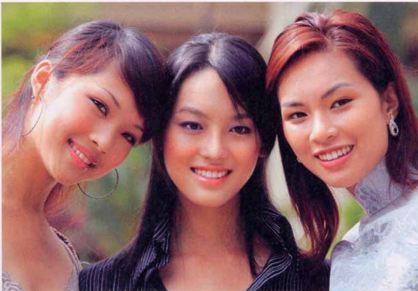
Asiatinnen mit operierten Lidfalten: Das neue Idealgesicht ist multikulturell geformt.