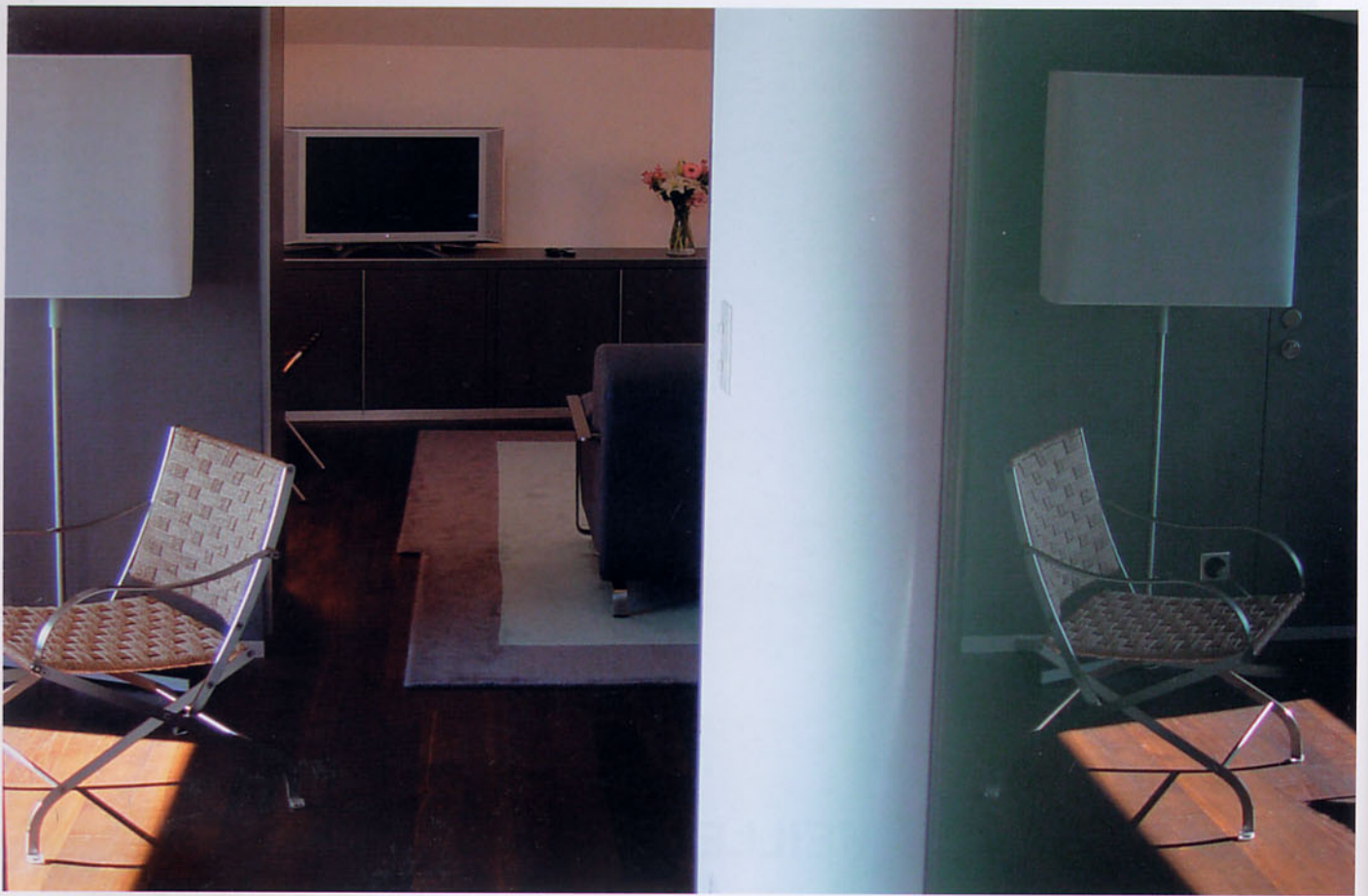
SUITE LUXUEUSE AVEC VUE SUR LE LAC